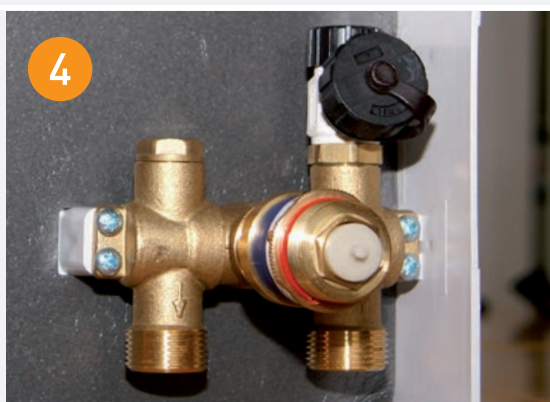
4 Thermostat-Aufsatz (inkl. Dehnstofffühler) aufschrauben