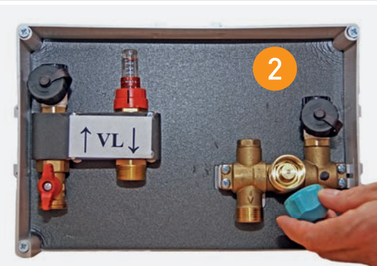
2 Ventilkörper nach vorne klappen und Schutzkappe entfernen