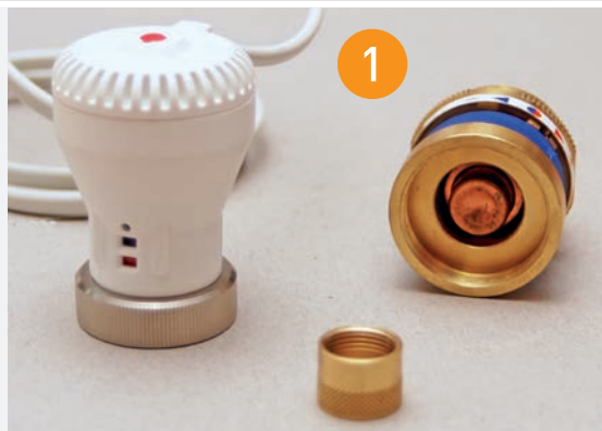
1 Bausatz, bestehend aus Stellantrieb, Thermostat-Aufsatz (inkl. Dehnstofffühler), Messinghülse