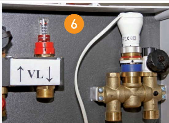
6 Ventilkörper zurück klappen